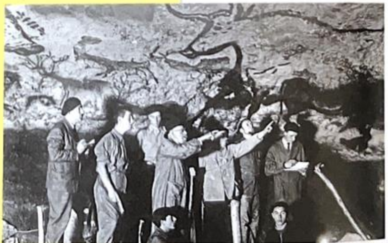
Premières visites de la grotte de Lascaux, 1940.

Article de Joffrey Vovos, © Le Parisien , 11 septembre 2010.